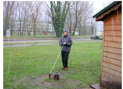
Fig. 1 : Mesures piézométriques du niveau de l'eau souterraine .