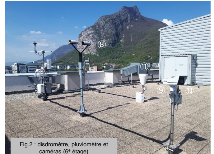
Fig.2 : disdromètre, pluviomètre et caméras (6° étage)