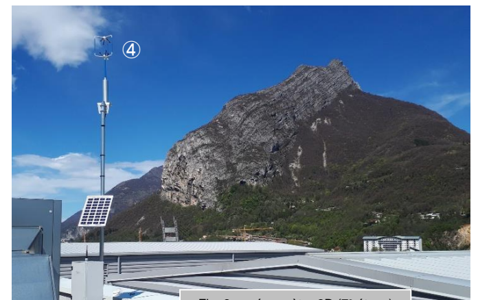
Fig. 3 : anémomètre 3D (7 e étage)