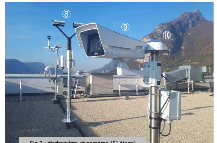
Fig.2 : disdromètre et caméras (6 e étage)