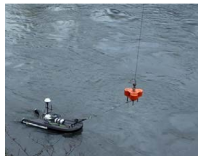
Profileur de courant Doppler acoustique (ADCP d'obs-eau)